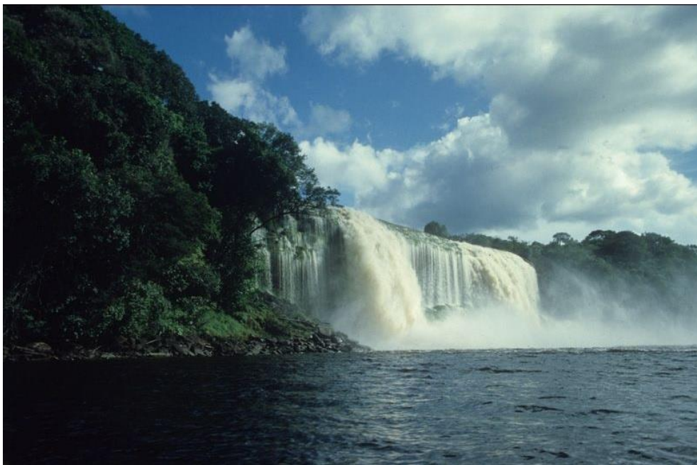
Jeden z vodopádů na Rio Carrao