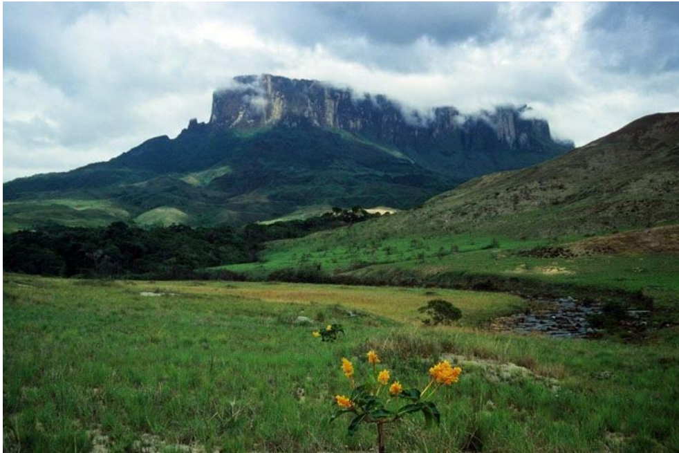
Stolová hora Kukenán-tepui v Guyanské vysočině

V květnu byla zahájena výstava “Venezuelská příroda” s podtitulem “Vzácné dokumenty z nyní nepřístupné země”.